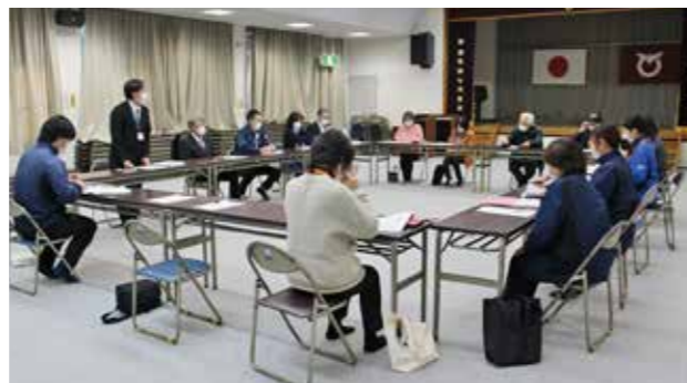
意見交換会の様子（富岡地区）

今後も意見交換会を定期的に開催し、関係機関とともに困りごとの発見、解決に向けた活動ができる体制づくりができればと考えています。