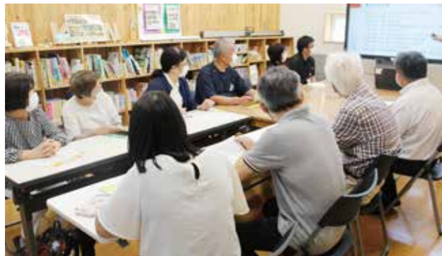
苓北支援学校にて学校運営に関する説明を受ける生活福祉・障がい者部会員ら