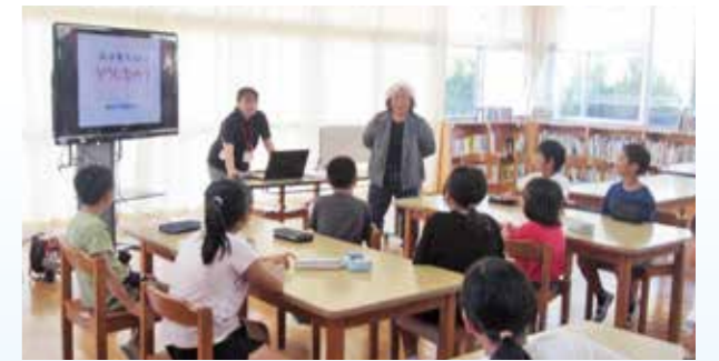
富岡小学校で開催された認知症サポーター養成講座の様子

養成講座の開催を希望される個人または団体の皆さん、お気軽にお問い合わせください。