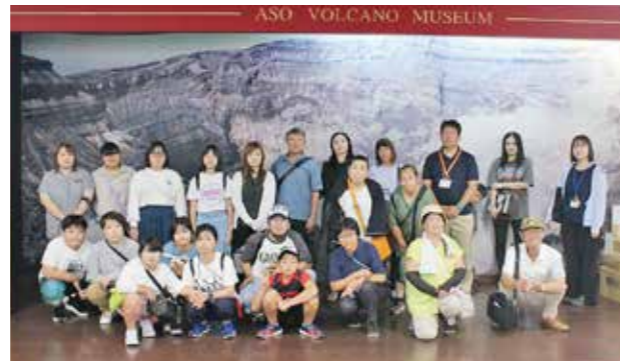
阿蘇火山博物館での集合写真

また、阿蘇ファームランドでは、ランチバイキングでおいしいものをたくさん食べた後に、施設内のお店でお土産を買ったり、充実した1日を過ごしました。