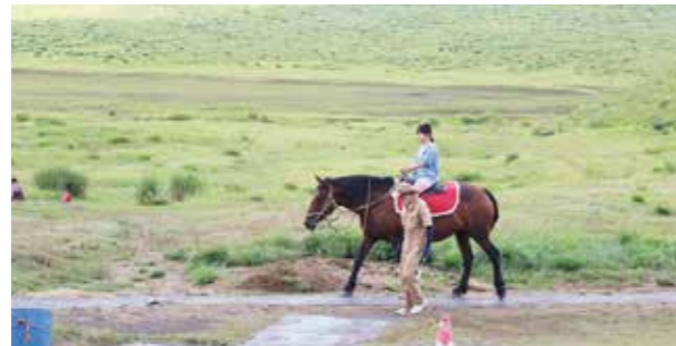
草千里での乗馬体験